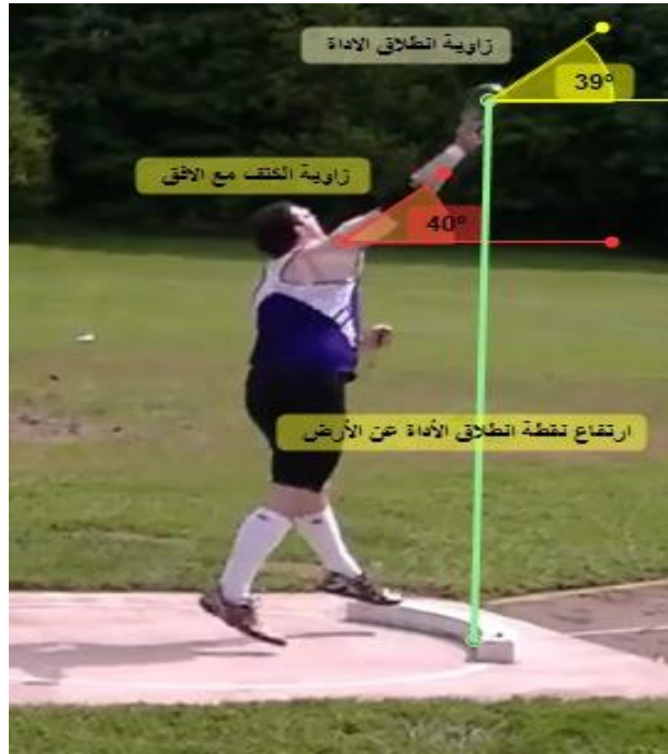
الشكل رقم (05) يبين بعض المتغيرات الكنماتيكية لمرحلة الرمي.