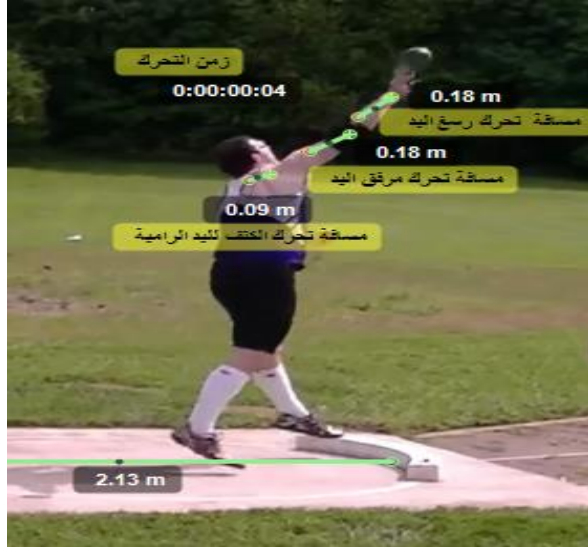
الشكل رقم (04) يبين كل من متغيري المسافة و الزمن لكل من الرسغ و المرفق و كتف اليد الرامية لمرحلة الرمي.